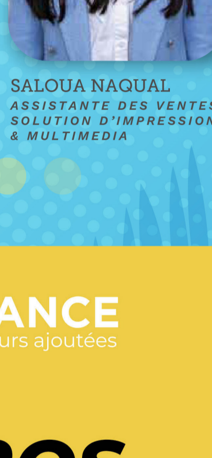
SALOUA NAQUAL ASSISTANTE DES VENTES SOLUTION D'IMPRESSION & MULTIMEDIA